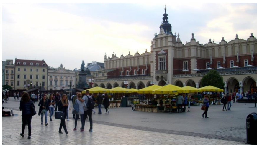
Rynek a Sukiennice v Krakově