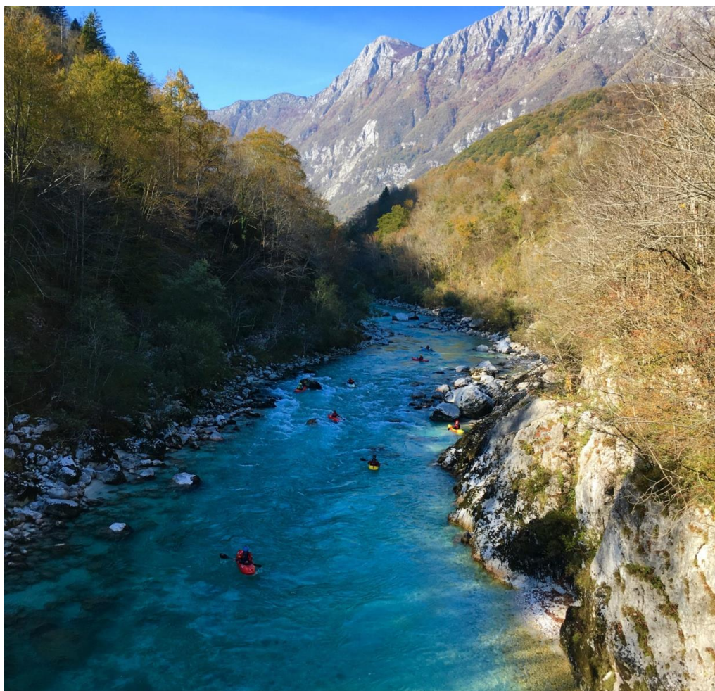
Obrázek 3: Smaragdová řeka Soča u Kobaridu