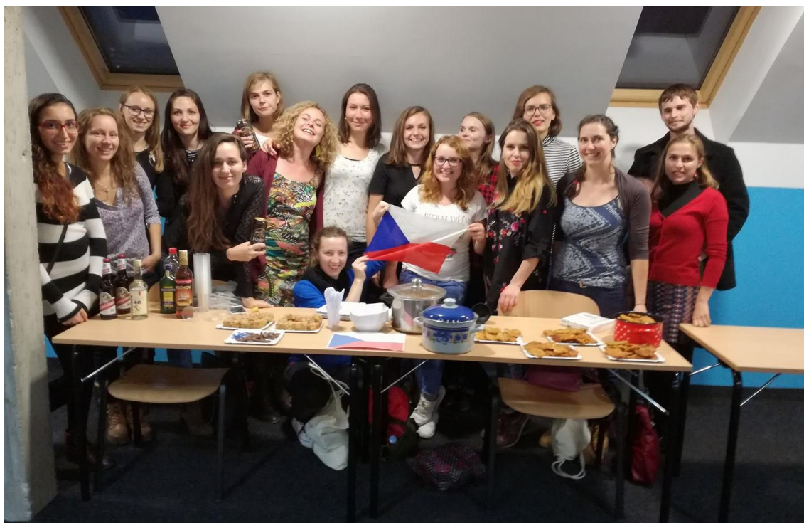
Obrázek 2: International dinner. Byli jsme nejpočetnější skupinka a bramboráky měly úspěch. ☺