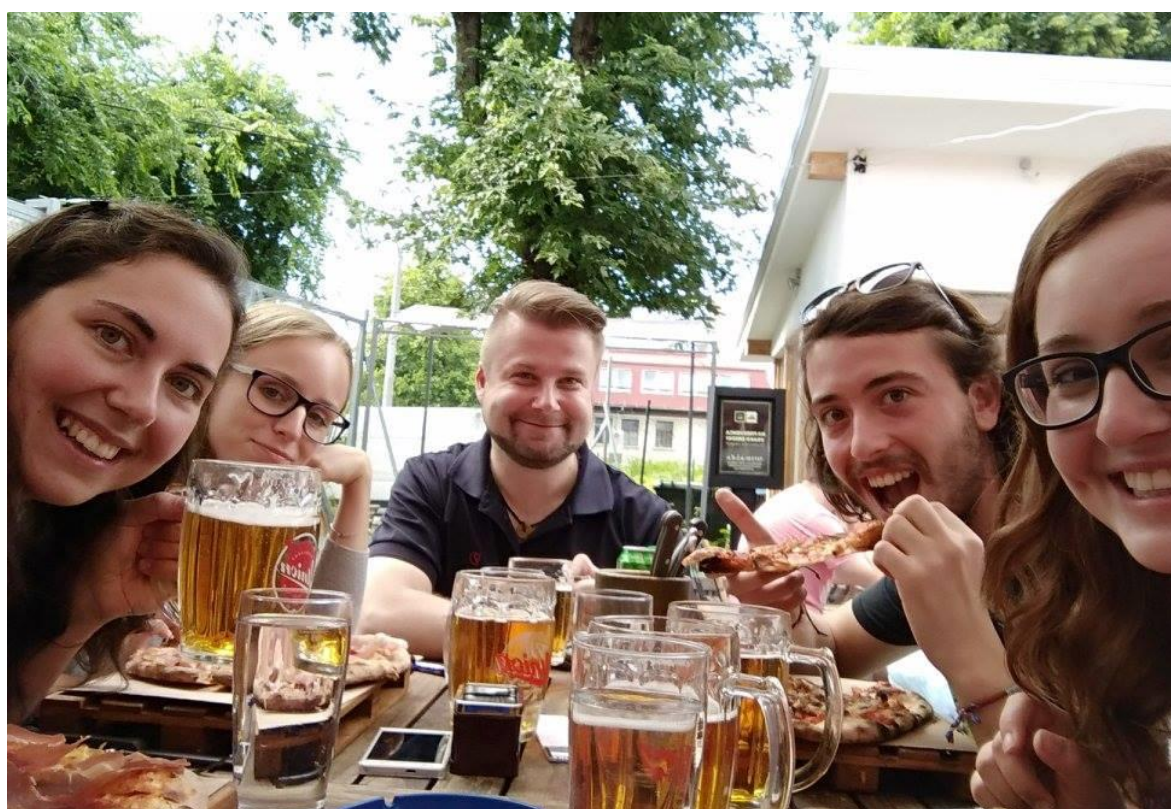
Obrázek 1: Náš první "Boni" oběd a první Lublaňské pivo Union. Paradoxně to pivo bylo dražší než celý náš oběd. :D

21:00)? Záleží na vás, na jaké jídlo máte zrovna chuť, je libo mexické, indické či italské? Průměrně se ceny se pohybují od 2 do 5 eur za obrovité porce jídla. Takže doporučuji si s sebou vzít volné kalhoty a krabičku, protože si tam budete jíst tak dobře, že nebudete chtít odjet. Mohla bych napsat celý román, jak krásně jsem se ve Slovinsku měla, ale myslím, že to musíte poznat sami. Takže neváhejte a jeďte.