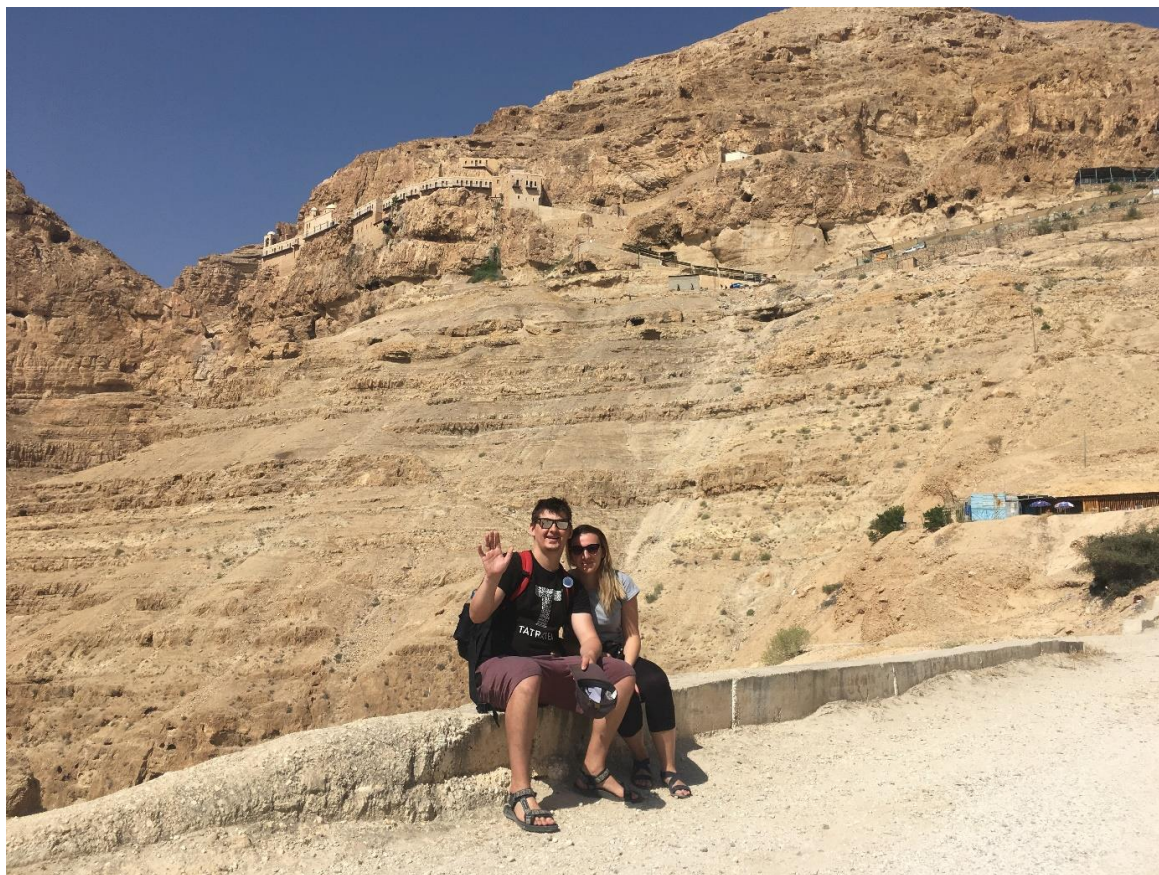
Monastery of the Temptation, Jericho, Palestina