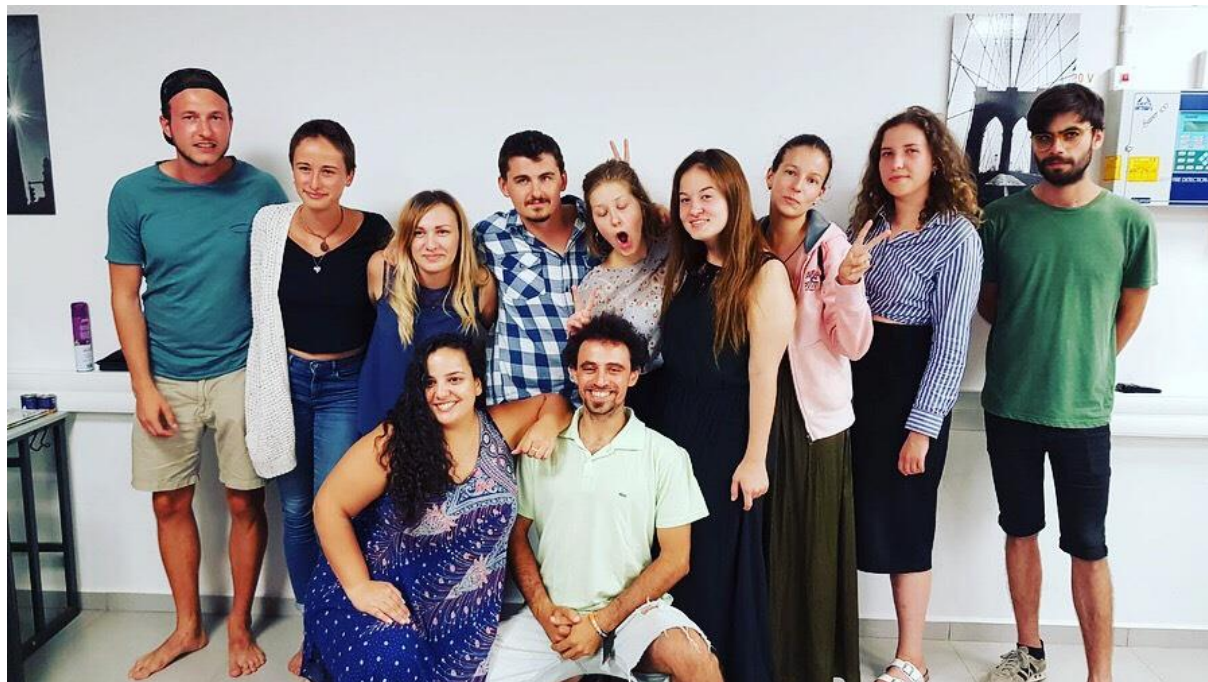
horní řada: všichni Erasmáci