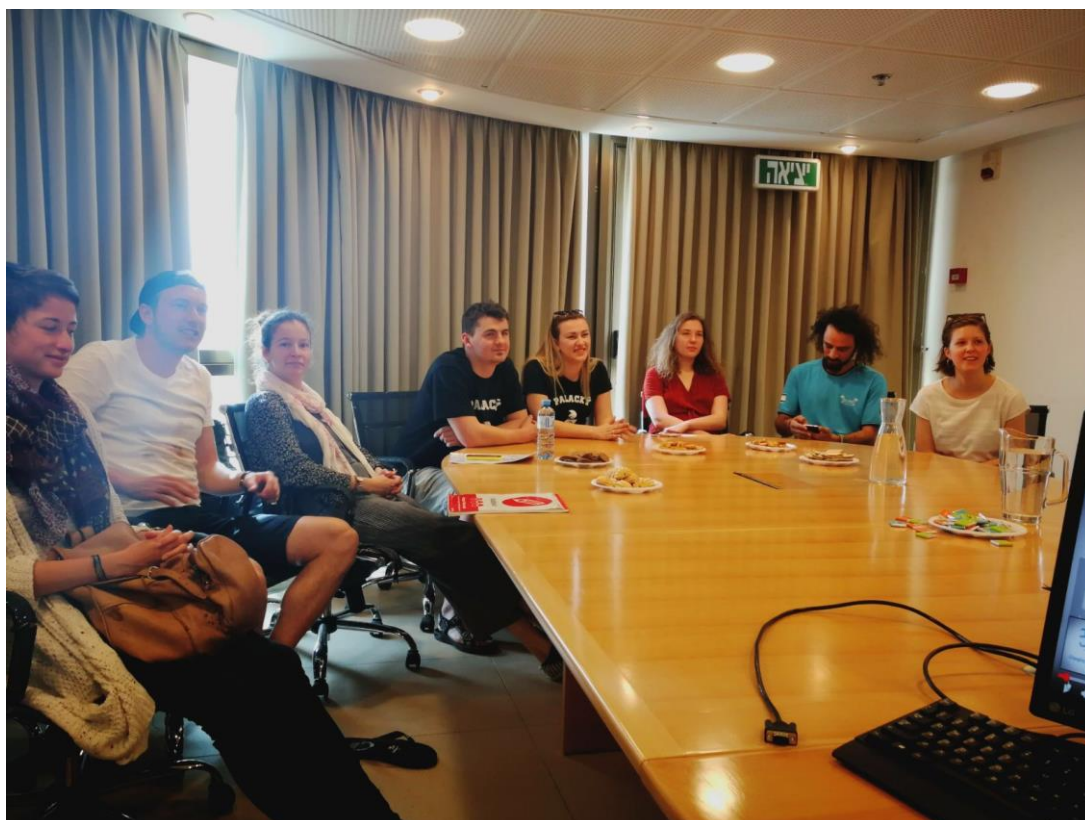
1. školní den