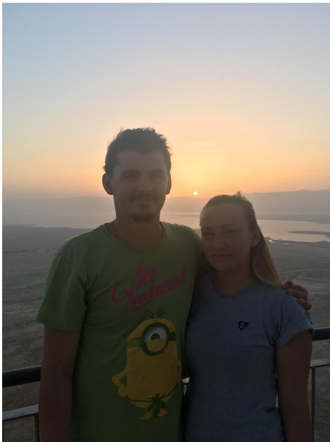
Pevnost Masada, Izrael