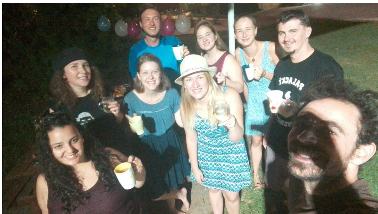
Utajená B-day party