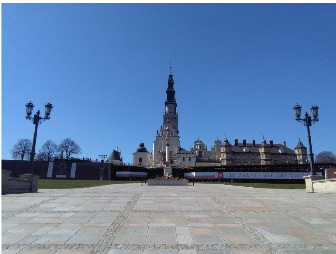
Obr. 2: Jasná Hora v Čenstochové