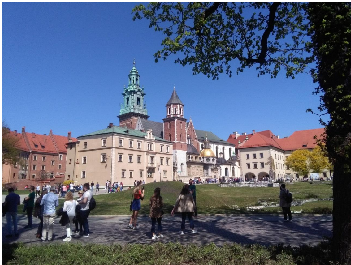
Obr. 1: Krakovský Wawel