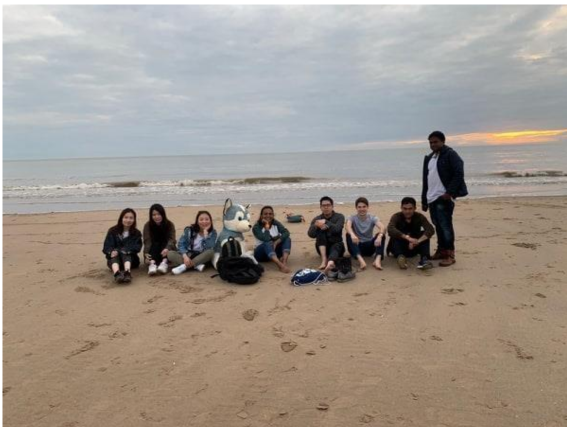
Obr. 29: Pleasure Beach v Blackpoolu