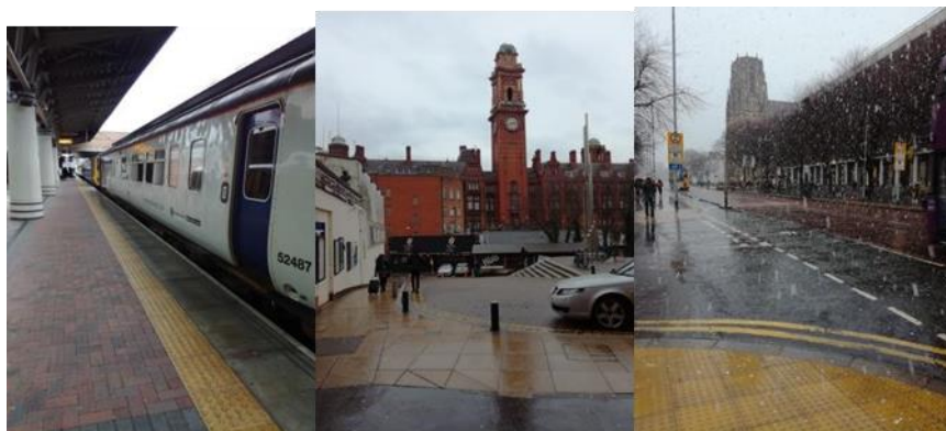
Příjezd do Anglie s chladným a deštivým uvítáním

„Kde jsem to sakra přijel?“, to byla první moje myšlenka, když jsem stál na vlakovém nádraží na letišti v Manchesteru. Pršelo, bylo poměrně chladno a obloha naprosto zatažená. Anglie je tímto počasím pověstná, co mě tam tedy přitáhlo?