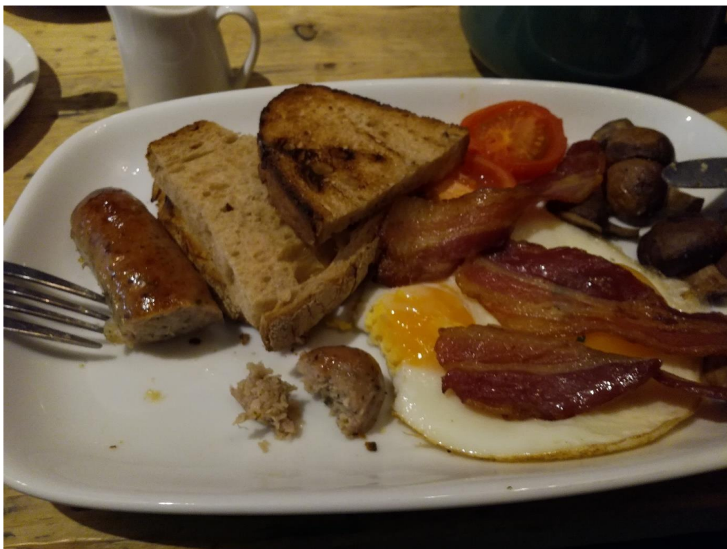
Obr. 9: Anglická snídaně