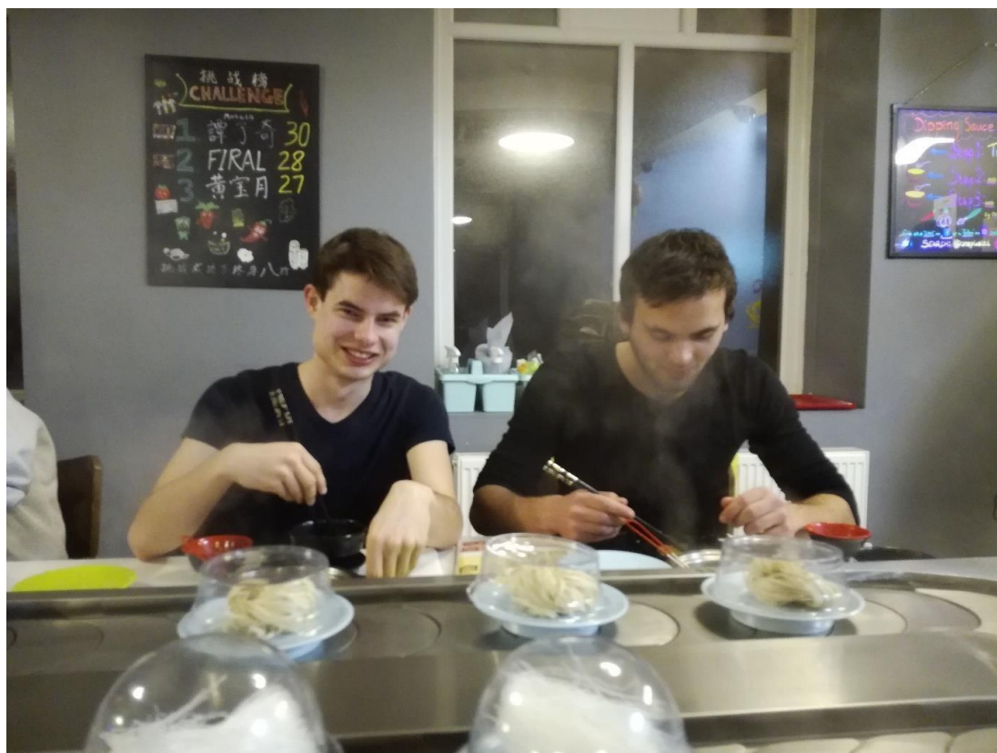
Obr. 11: Evropan a Američan ochutnává pálivou čínskou kuchyni s komentářem studentů z Hong Kongu a Číny