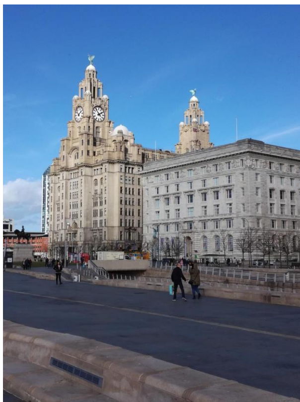
Obr. 21: Liverpool – město hudby