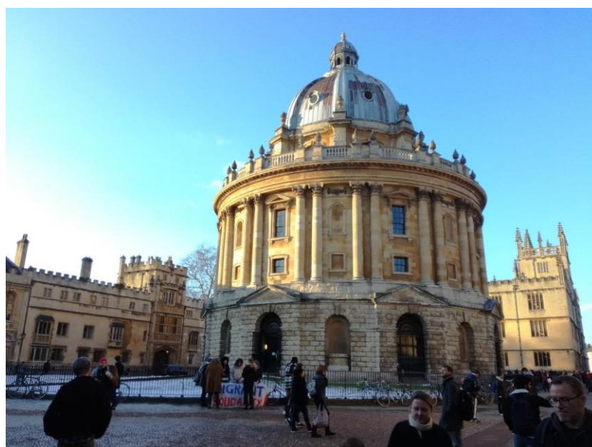
Obr. 25: Oxford