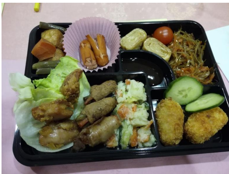
Obr. 12: Japonský večer v International Society