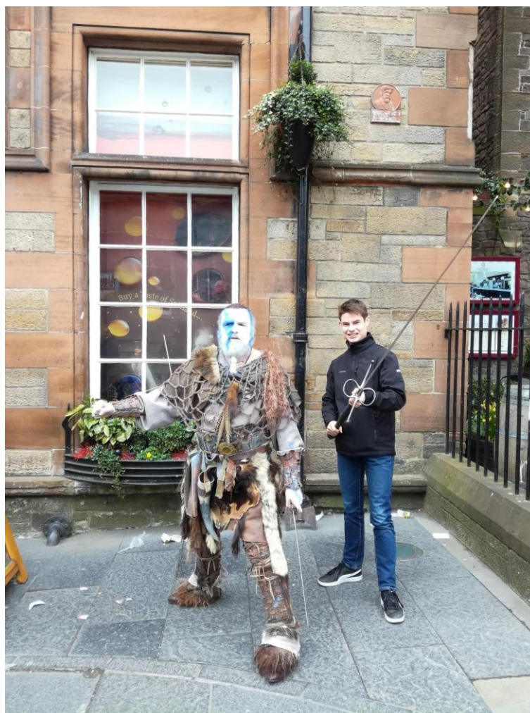
Obr. 26: Edinburgh