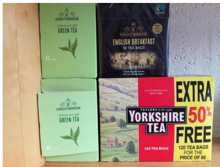
Obr. 7: Zkouška různých druhů čaje