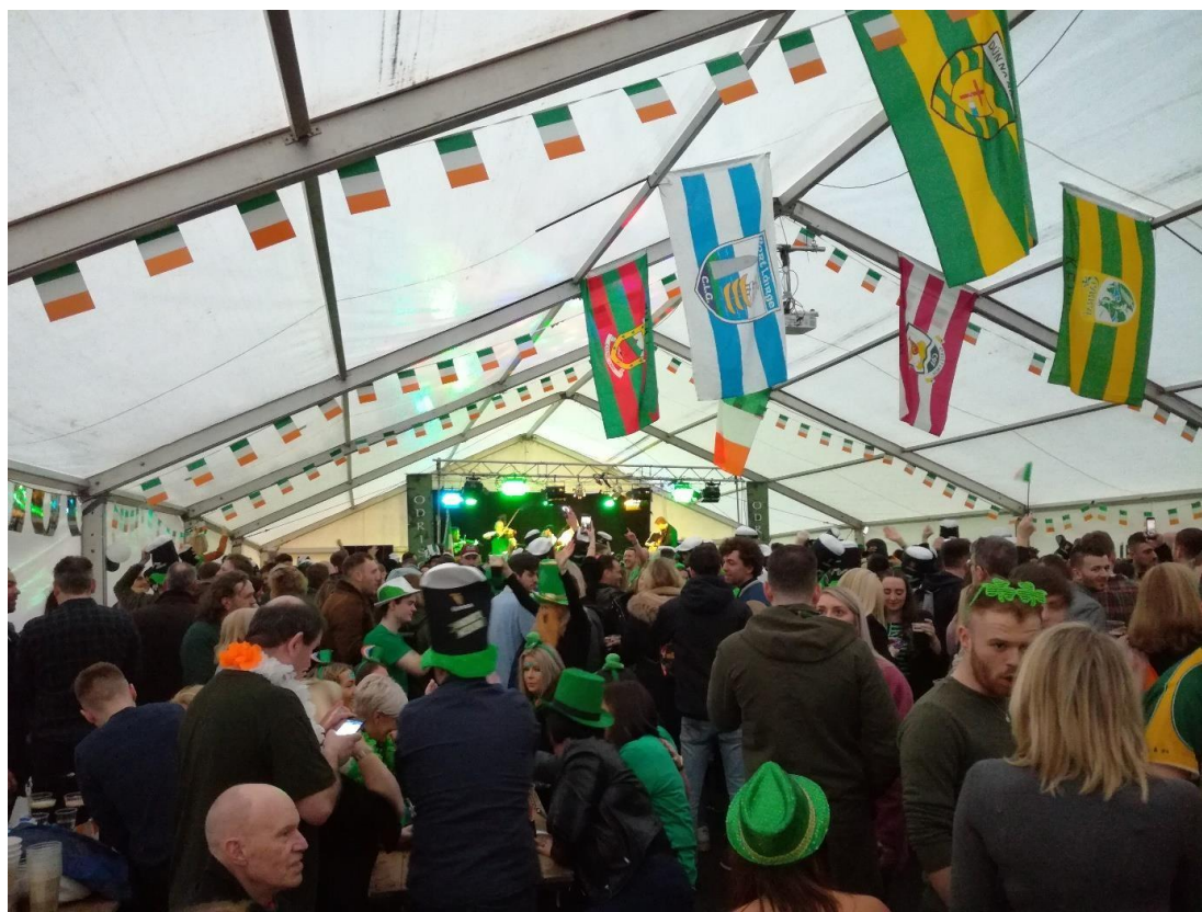
Obr. 10: Den svatého Patrika – jeden den v roce, kdy Anglie trochu připomíná Irsko