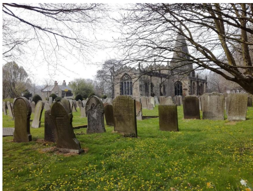
Obr. 27: Anglický tajemný až strašidelný venkov