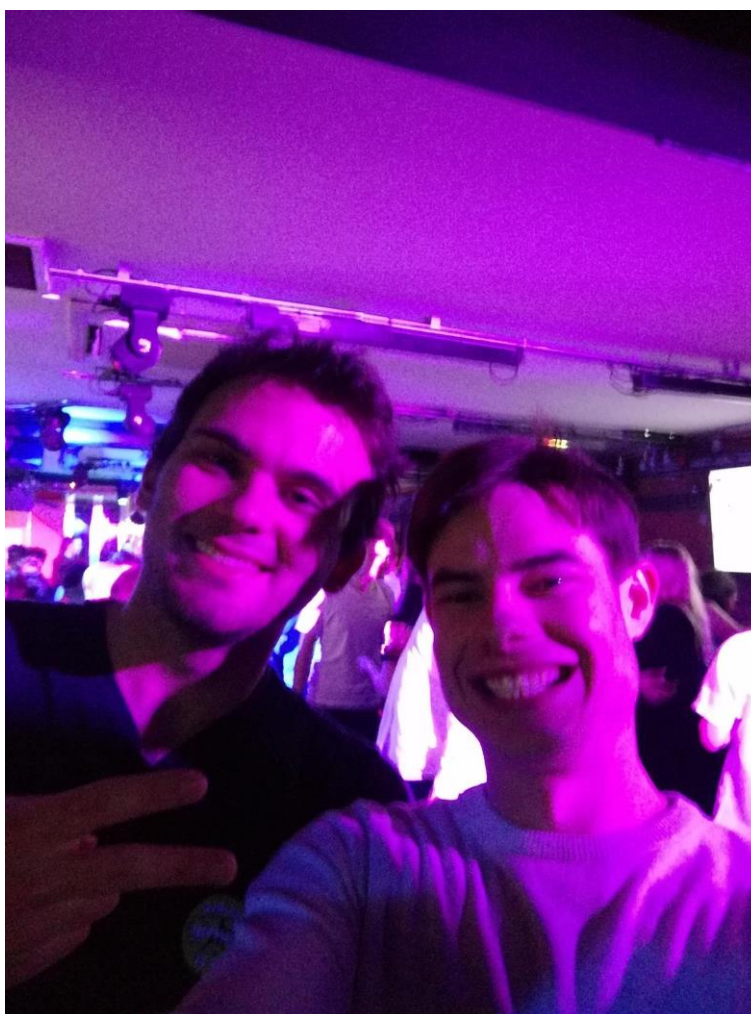
Obr. 13: Noční život v Manchesteru