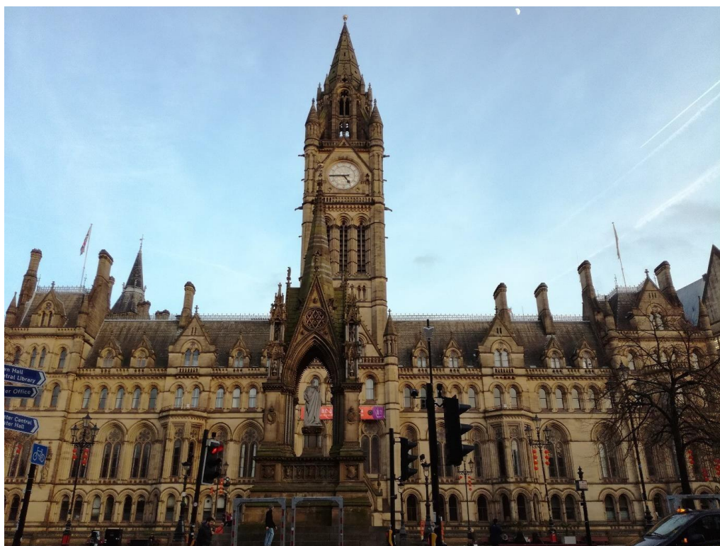
Obr. 2: Radnice v Manchesteru