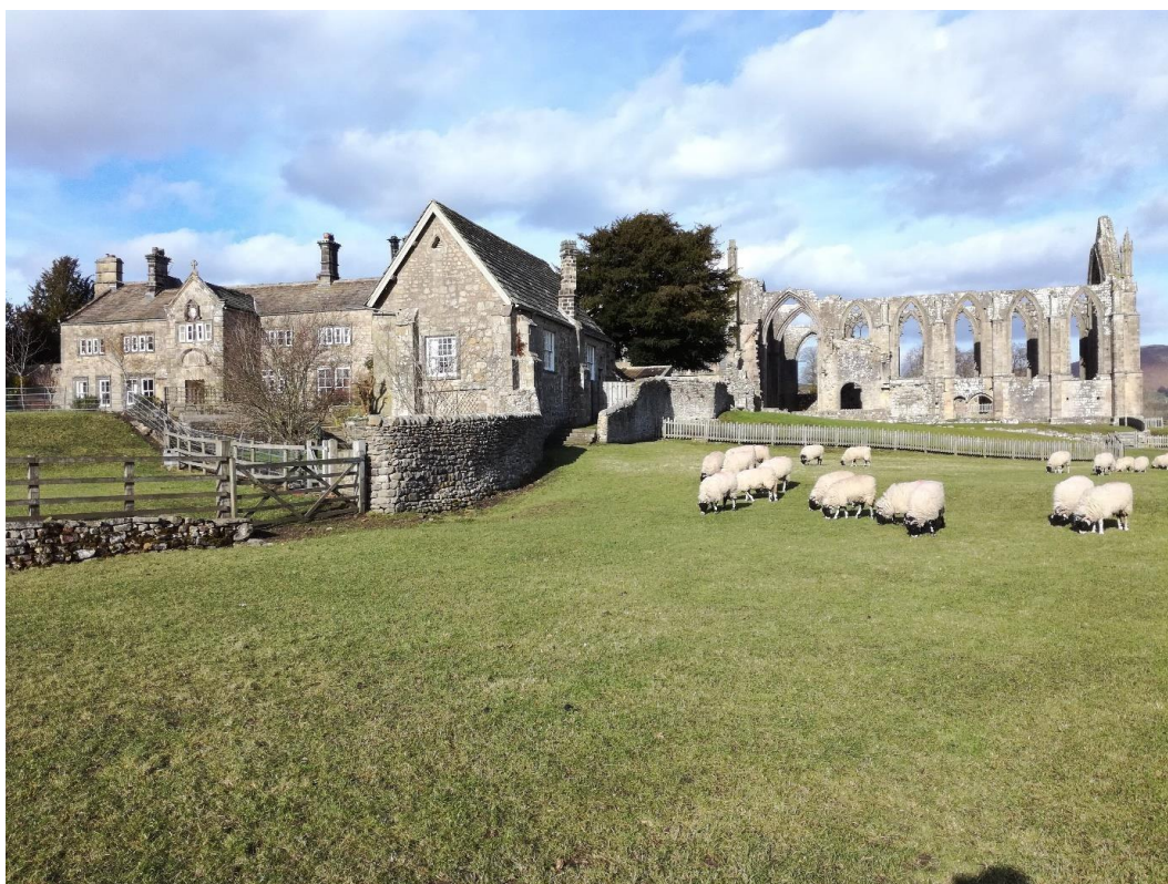
Obr. 15: Yorkshire Dales – Bolton Abbey