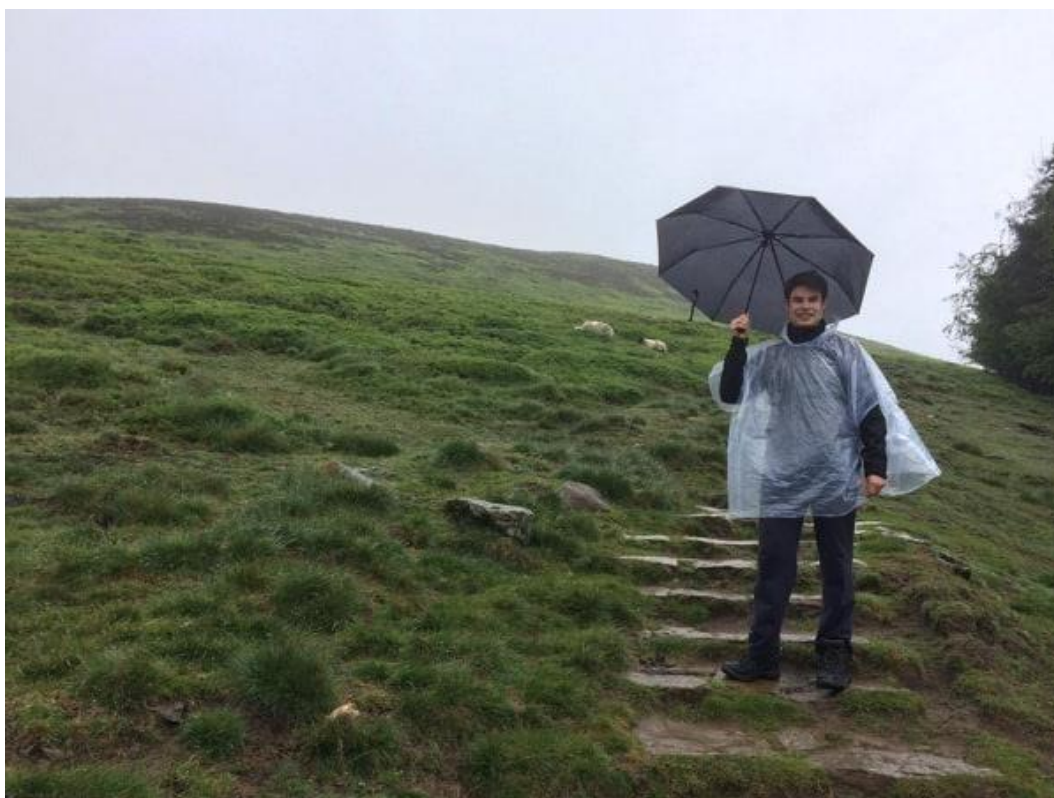
Obr. 14: Tato fotka asi nejvíce vystihuje počasí, kdy díky silnému větru prší ze všech stran