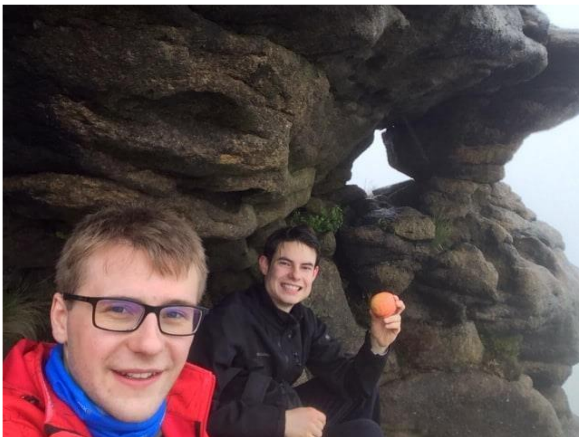
Obr. 28: Výprava do Peak District v extrémním počasí, přístřešek nalezen asi po třech hodinách hledání v podobě malé jeskyně