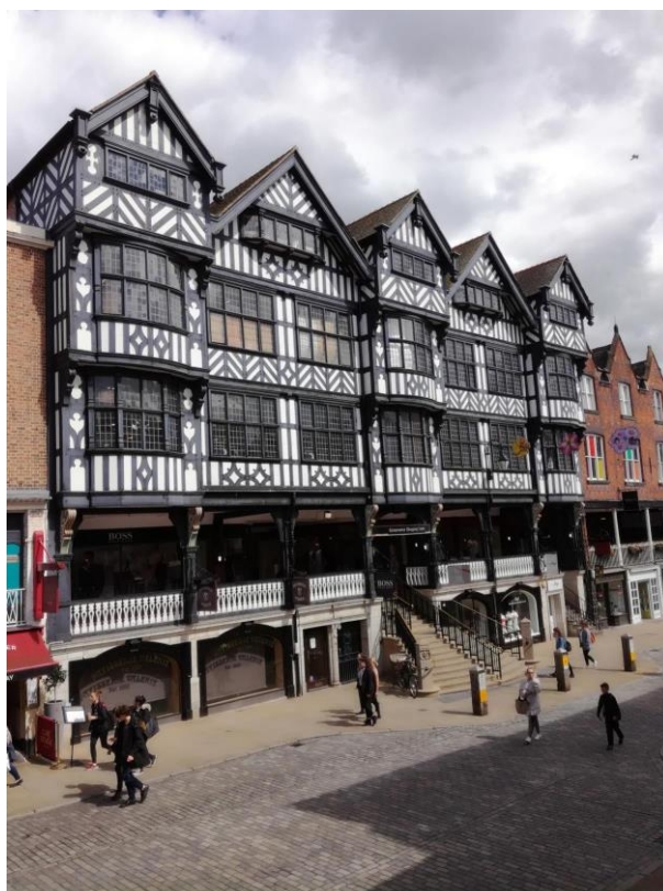
Obr. 18: Chester – malebné městečko plné této tudorovské architektury