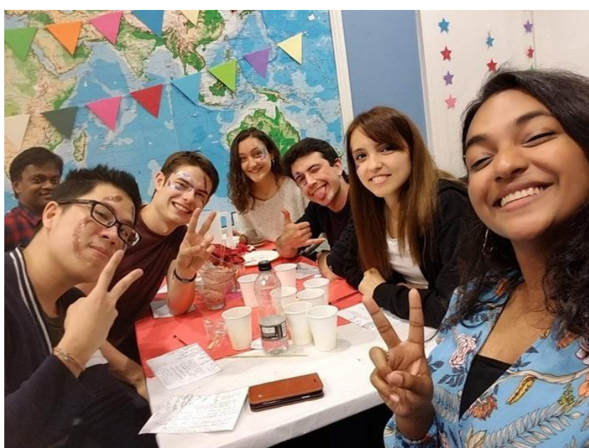
Obr. 5: Jedna z událostí v sídle International Society