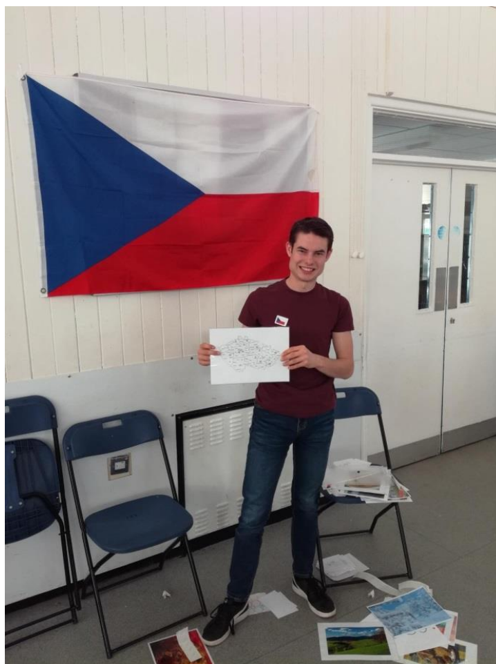
Obr. 4: Projekt RocketWorld pro studenty základních škol v Anglii