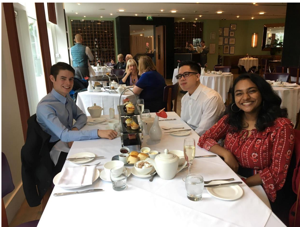
Obr. 8: Tradiční anglický odpolední čaj, snaha být alespoň jednou pravi „posh“ angličané