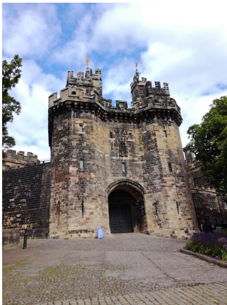
Obr. 16: Hrad v Lancasteru – méně známá destinace, nicméně velmi dobře zachovalý hrad