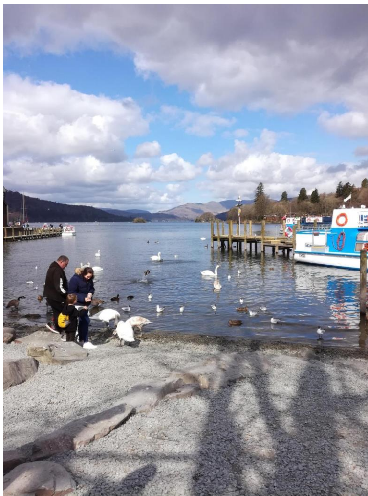
Obr. 24: Lake District