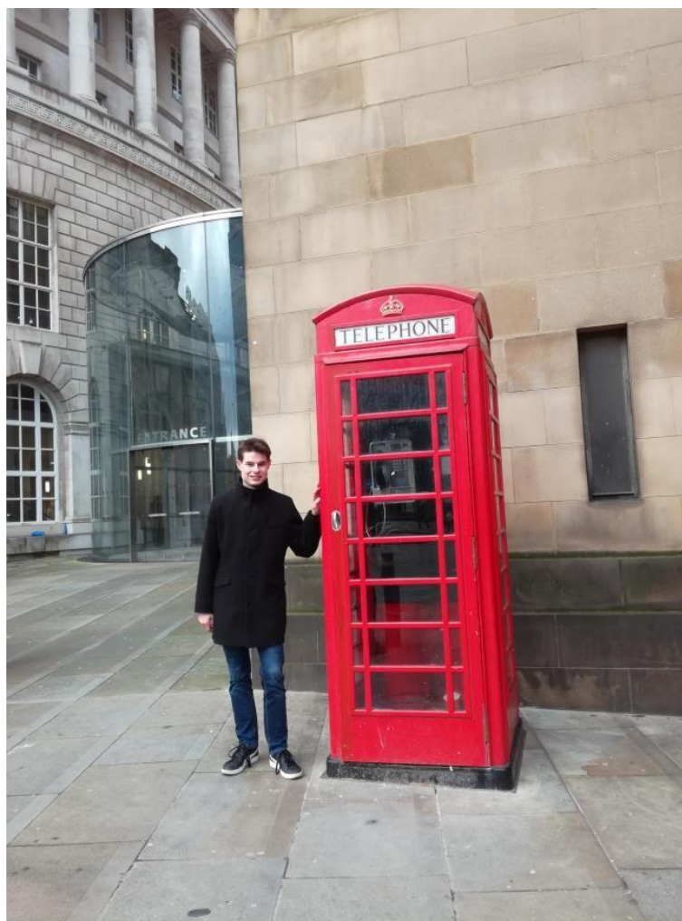
Obr. 6: Znamé anglické telefonní budky