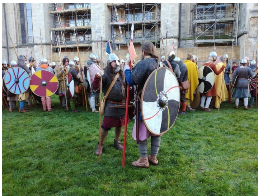
Obr. 22: Festival Jorvik – každoroční ukázka vikingské kultury v Yorku