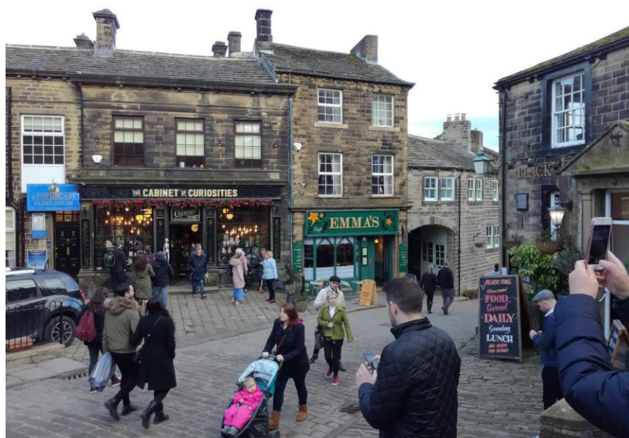
Obr. 17: Haworth