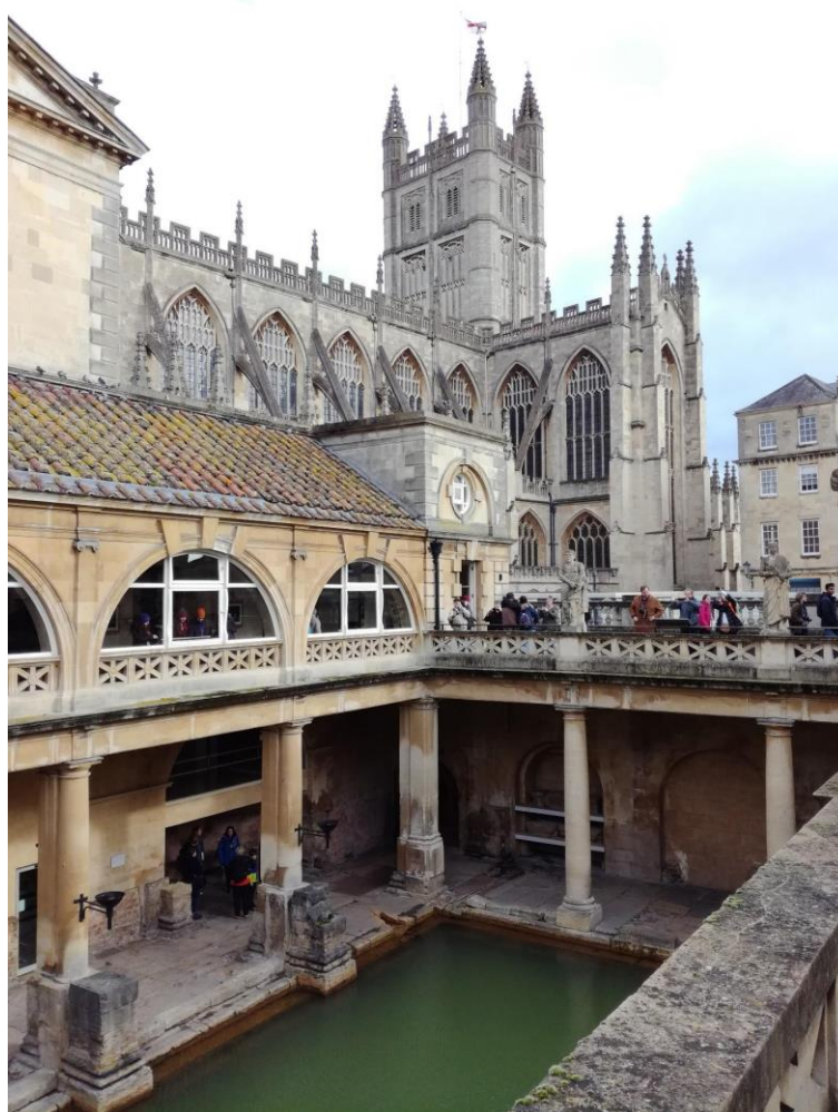
Obr. 23: Bath – město, které si zachovalo hodně aspektů z doby, kdy se usadili v Anglii římané