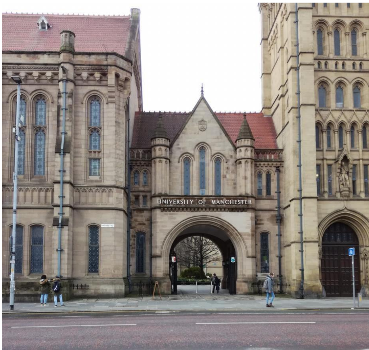
Obr. 1: Hlavní kampus University of Manchester

Podání přihlášky na Erasmus+ je mimo jiné velmi jednoduché a vše vyřešíte online. Pokud jsem vás přesvědčil, tak nezapomeňte, že to není jen o studiu. Zkuste se zapojit do studentských spolků, navazovat kontakty z celého světa, cestovat a vytěžit z toho maximum.