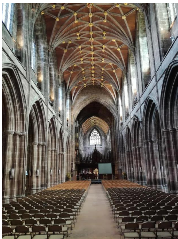
Obr. 20: Anglické katedrály – něco pro zájemce o architekturu, historii nebo Harryho Pottera