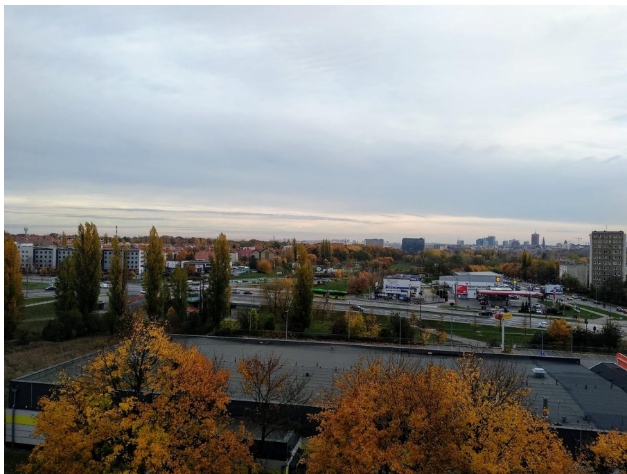
Poznaň z balkónu