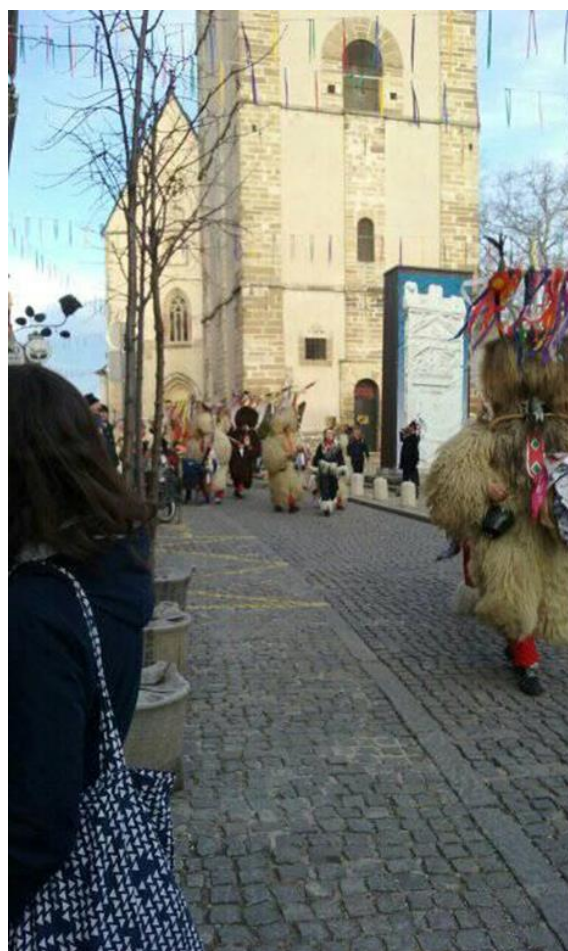
Kurentovanje ve městě Ptuj