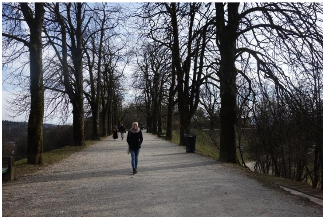
mé první dny v Lublani – promenáda u lublaňského hradu