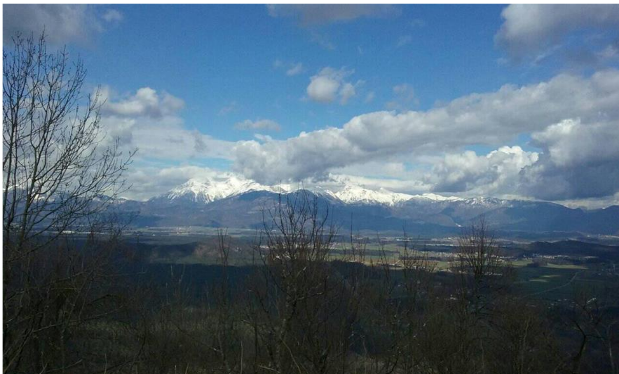
výhled na slovinské Alpy z vyhlídky poblíž Lublaně