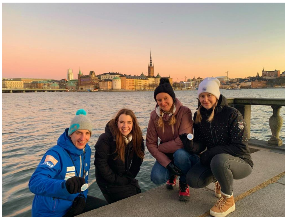
Stockholm – výhled od radnice na Staré město (Gamla stan)