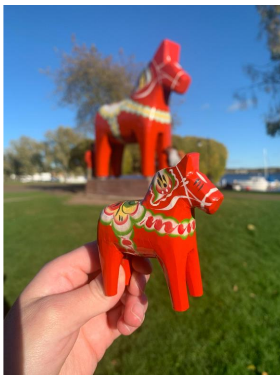
Dalarnský kůň (dalahäst) – ručně vyřezávaný a malovaný koník, jde o jeden z neznámějších symbolů Švédska, který má svůj původ v kraji Dalarna