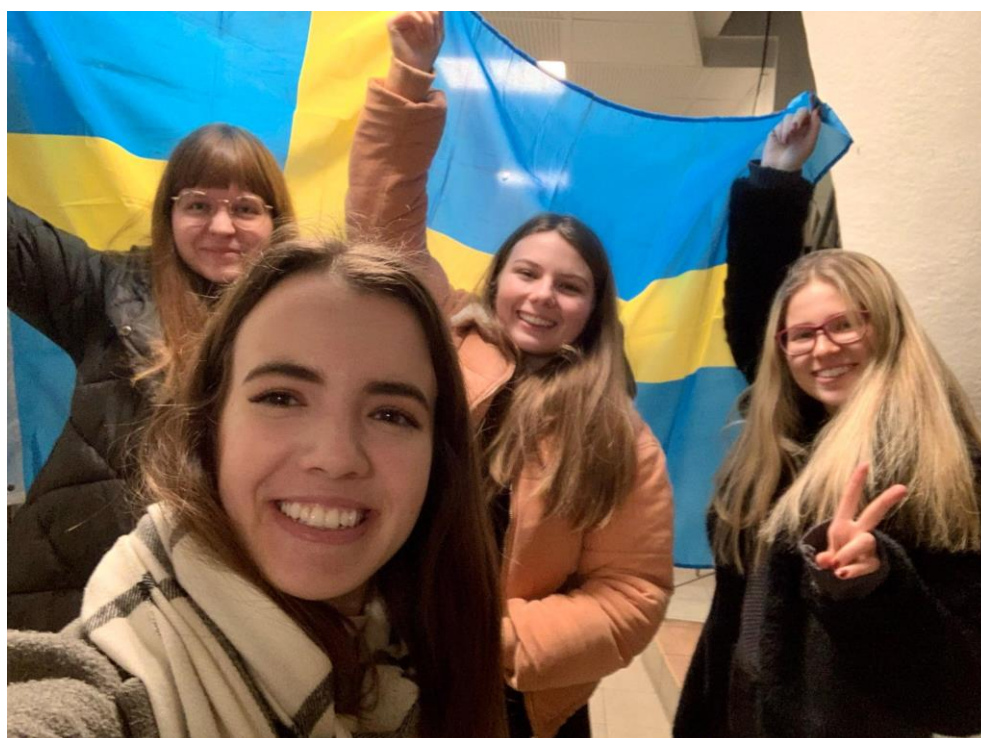
Rozloučení se Švédskem