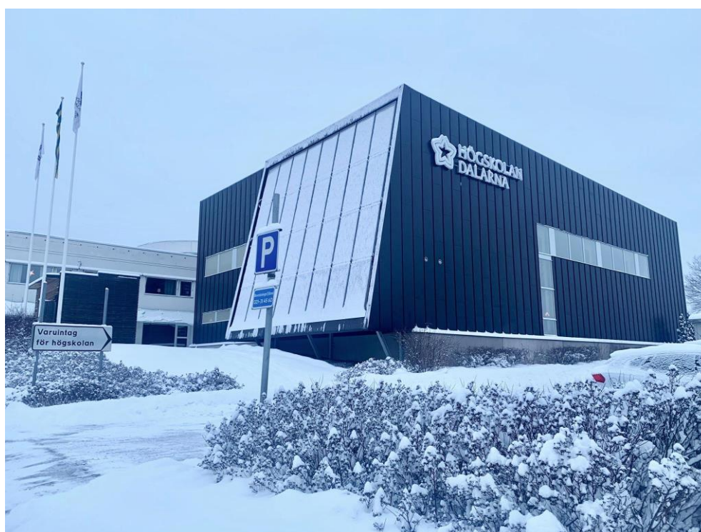
Budova univerzity v Borlänge

Studium v rámci programu Erasmus+ bylo pro mě velmi obohacující a nezapomenutelnou zkušeností. Získala jsem nejen nové znalosti, ale také přátele z různých koutů světa. Pokud jsem to zvládla já, jakožto velký introvert, věřím, že to dokáže kdokoli – a odměnou vám bude spousta zážitků a cenných zkušeností do života.