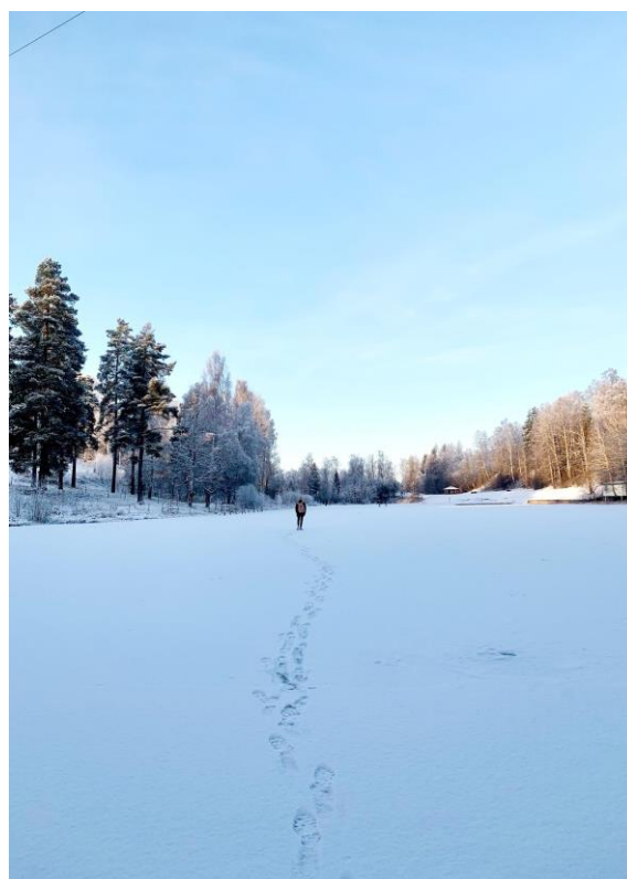
Procházka po zamrzlém jezeře Båtstasjön poblíž Borlänge