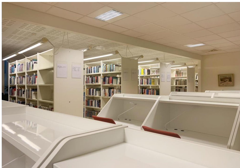
Univerzitní knihovna v Borlänge