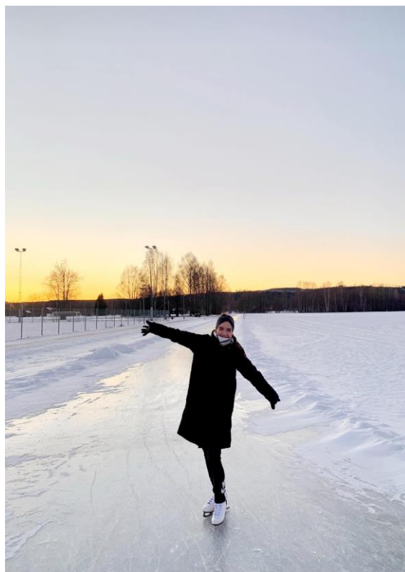
Kluziště poblíž našeho ubytování