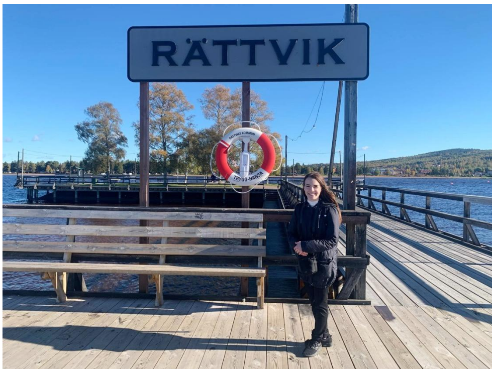
Molo na jezeře Siljan v Rättviku – jezero je oblíbenou letní turistickou destinací pro Švédy, samotný Rättvik je známý především pro své více než půl kilometru dlouhé molo