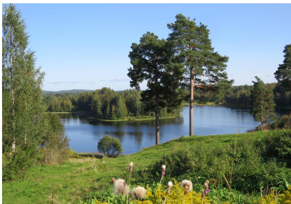
Jezero Hemsjön poblíž Borlänge