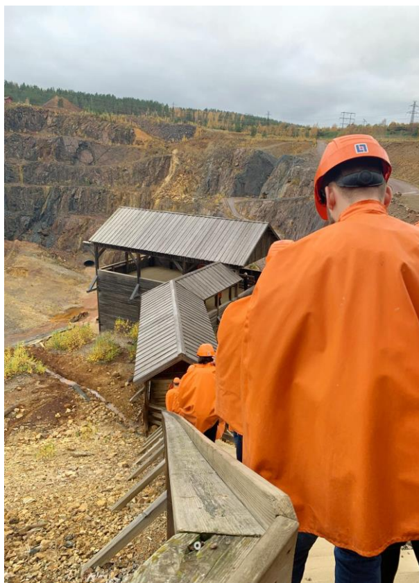
Měděný důl ve Falunu – odsud pochází pigment, který se používá na typický červený nátěr švédských domů