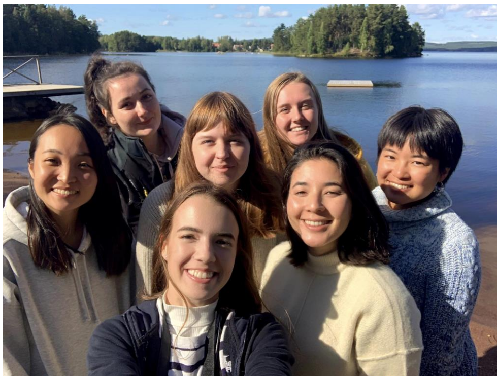
U jezera Varpan ve Falunu