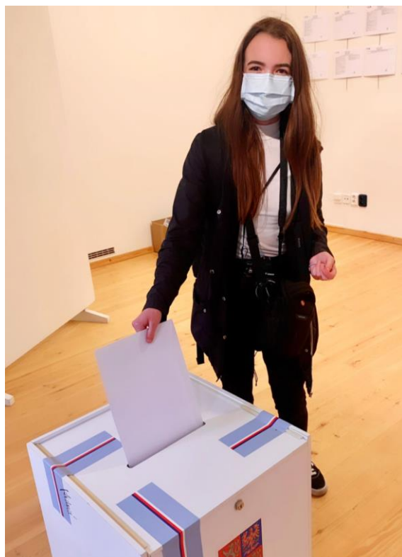
Volby do PS ČR na Velvyslanectví ČR ve Stockholmu