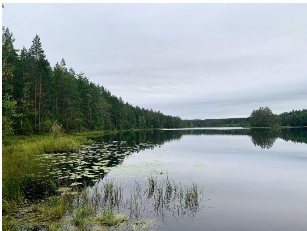
Jezero Bjukan poblíž Borlänge