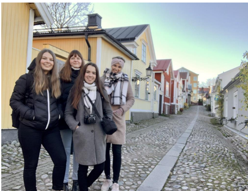
Gamla Gefle v Gävle – nejstarší část města známá svými zachovalými dřevěnými domy