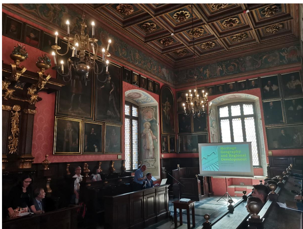
Jedna z nejkrásnějších místností Jagiellonské univerzity, kde proběhla první přednáška