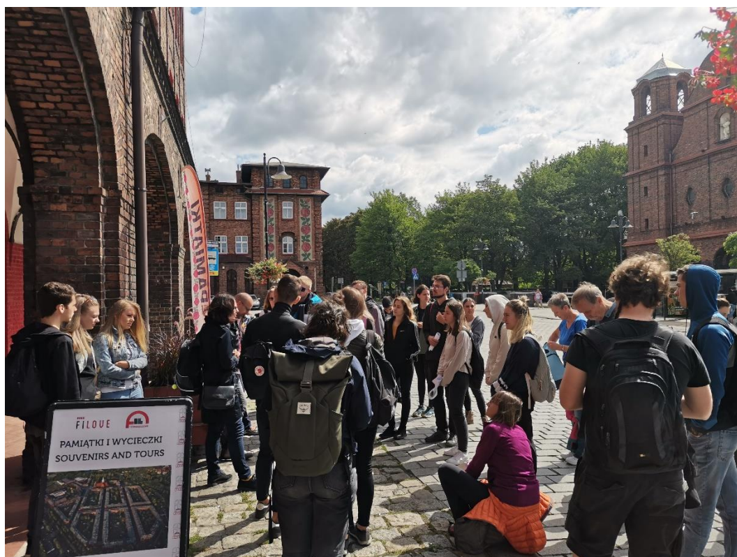
Na exkurzi v katovickém Nikiszowci