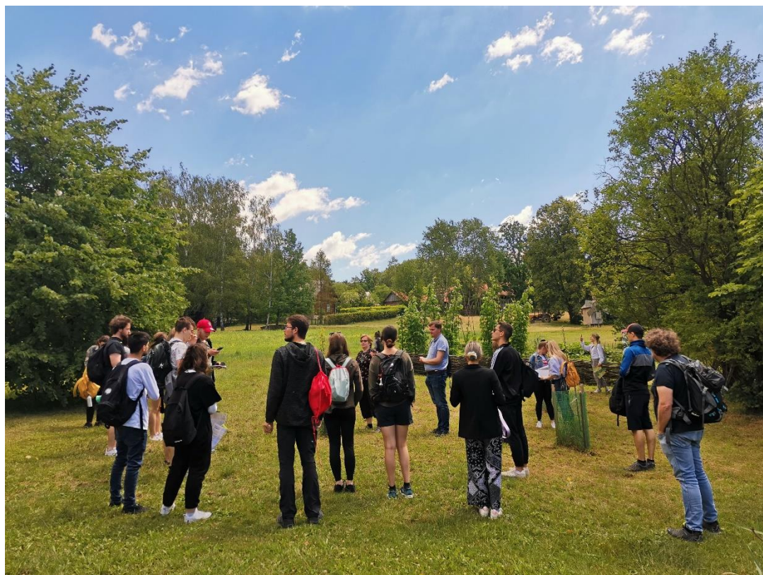
Na exkurzi v etnografickém parku