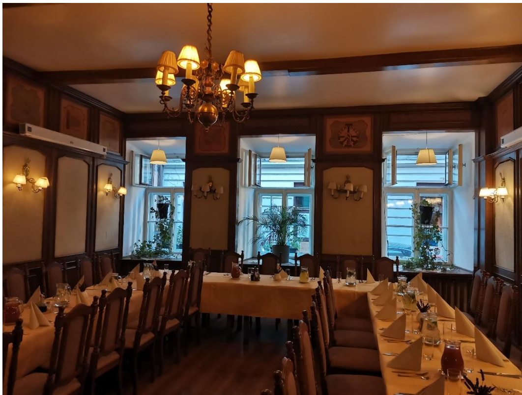
Luxusní restaurace pro slavnostní večeři na uvítanou