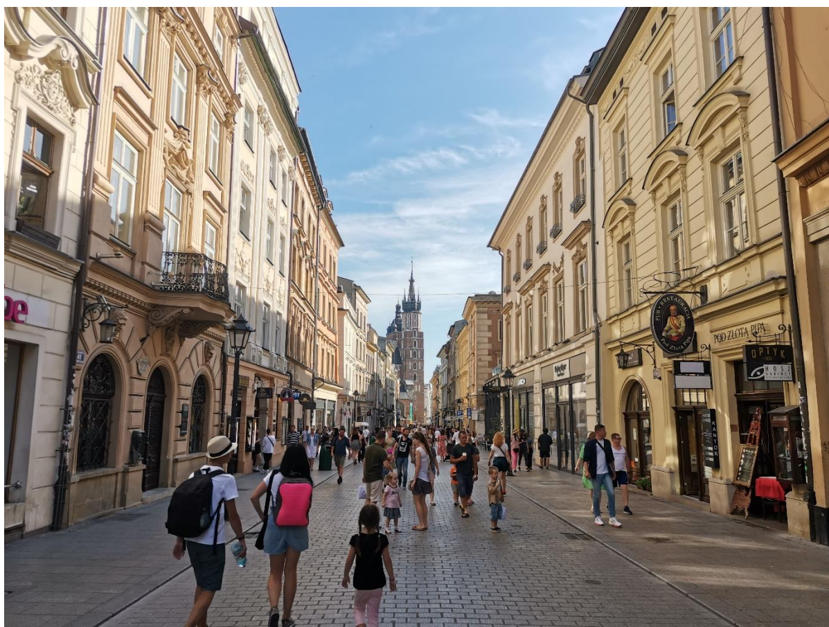
Na prohlídce centra Krakova