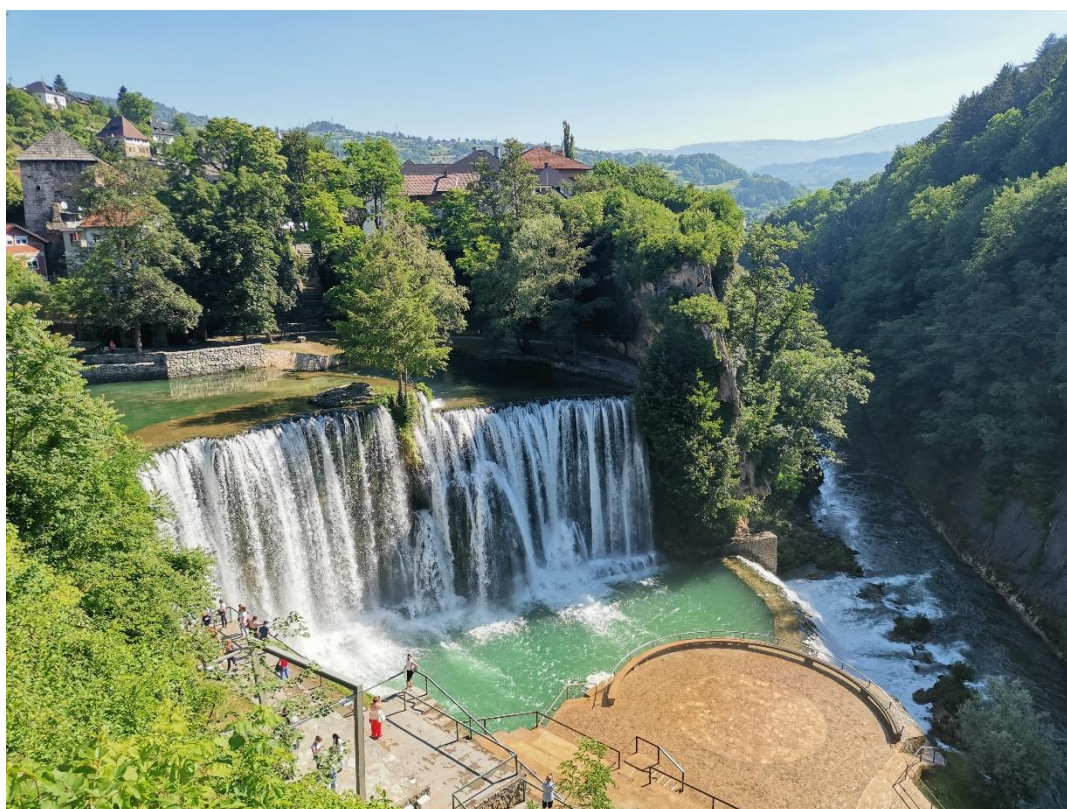
Vodopád v městě Jajce