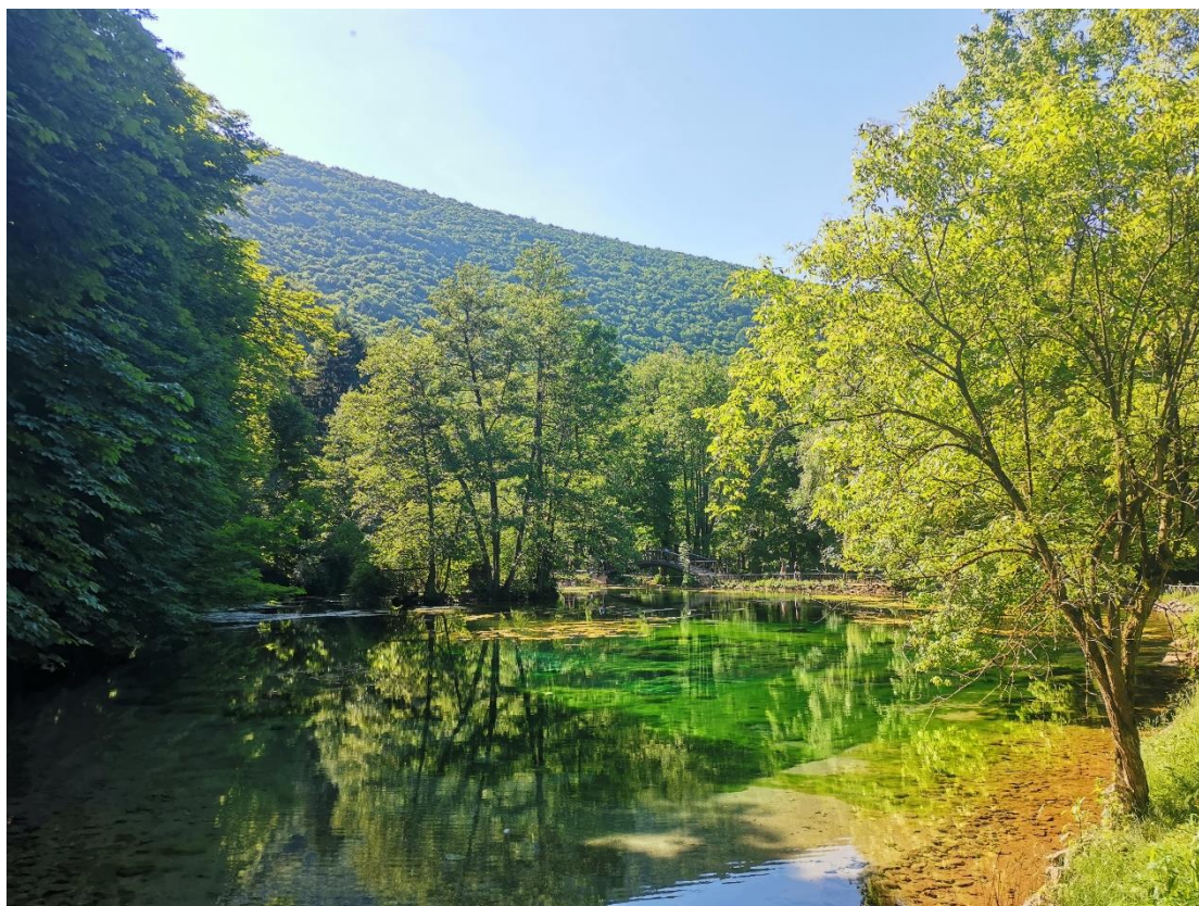
Pramen řeky Bosny