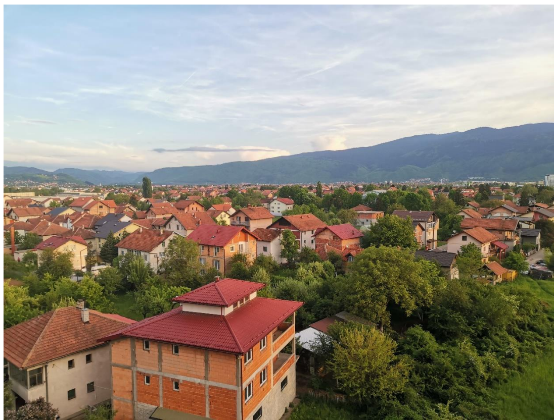
Výhled z okna ubytování (Naselje Bulevar)