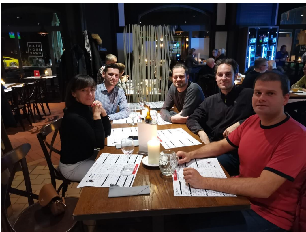
S kolegy z inženýrského oddělení