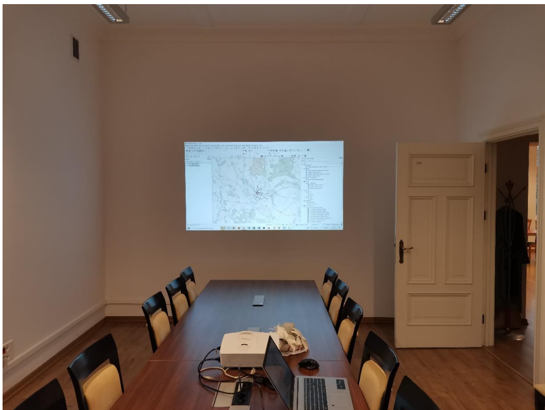
Místnost pro prezentaci výsledků v GIS