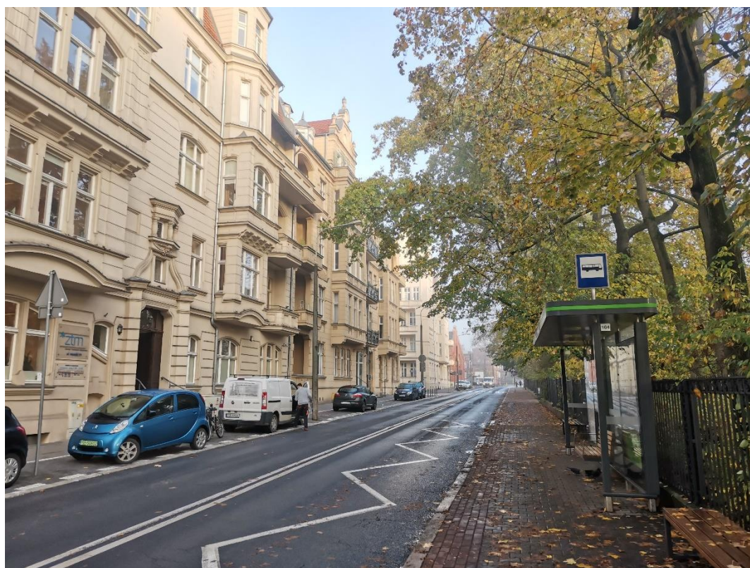
Budova ZTM Poznaň spolu s přílehlou autobusovou zastávkou Palmiarnia

Pro zájemce o pracovní stáž doporučuji nenechat vše na poslední chvíli, ale s velkou časovou rezervou a dostatkem trpělivosti napsat co nejvíce potenciálně vhodným zaměstnavatelům, neočekávat úspěch na první dobrou, ale mít více možností v zásobě a po nalezení se v klidu domluvit na konkrétních podmínkách tak, aby vždy byl čas na případné neočekávané změny. Na rozdíl od studijního Erasmu je vyřizování složitější, časově náročnější a pravděpodobně bez jakýchkoliv kreditů. Po absolvování pracovní stáže získáte ale praktické zkušenosti, cenné kontakty, a především komparativní výhodu na trhu práce. Vašemu životopisu jakákoliv zmínka o odborné práci v zahraničí rozhodně neuškodí 😊.