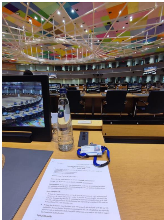
Čekání na schůzi