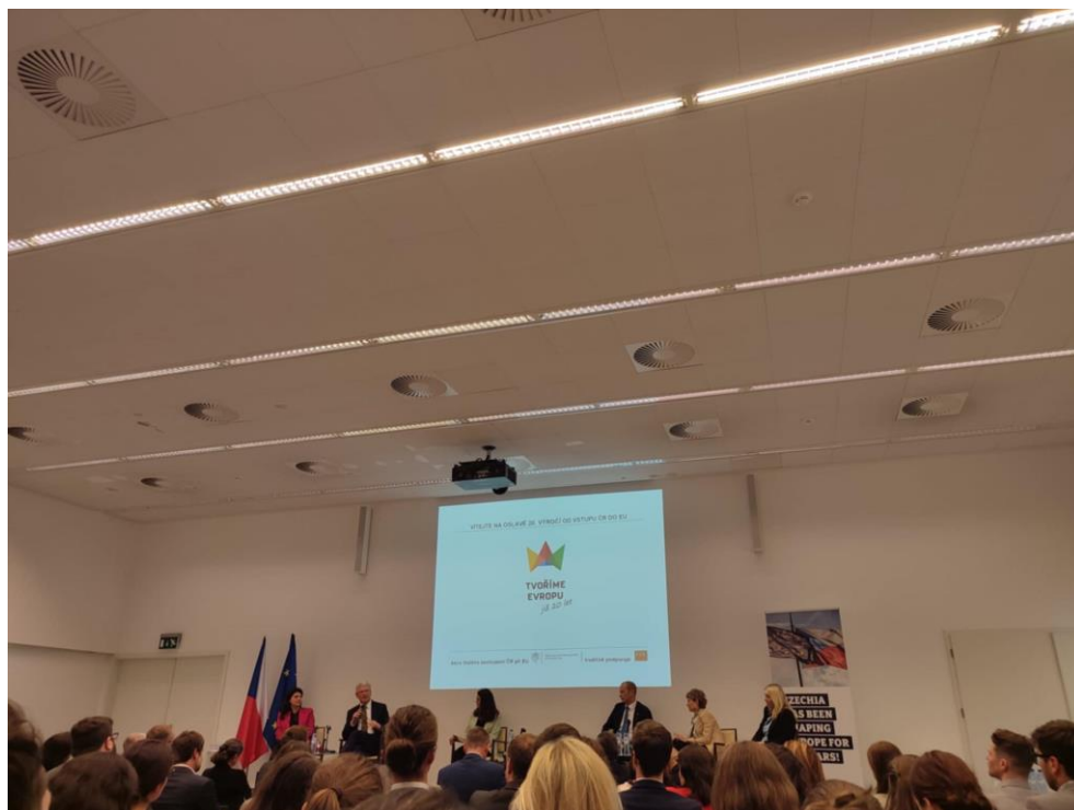
Zahájení oslav 30 let ČR v EU