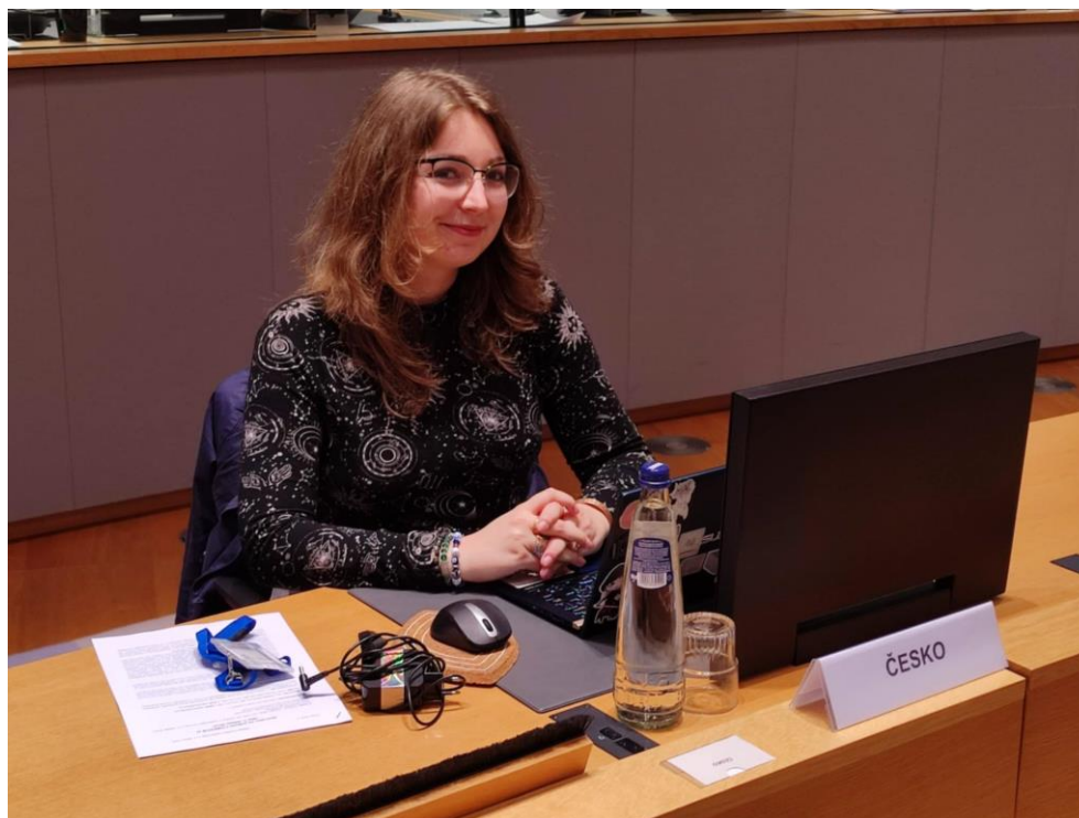
Jednání výboru COREPER II o prodloužení pomoci Ukrajině

Ve svém volném čase jsem kromě studijních povinností cestovala po Belgii a našla si kamarády v Antverpách, kteří mě zasvětili do toho, jaký byrokratický bordel panuje v království, které jsou vlastně dvě země, které se nesnáší spleené izolepou. Pozvali mě na jejich setkání ze střední, kde jsem byla svědkem belgického učitelského karaoke a děsila místní češtinou. Navštívila jsem Bruggy, Waterloo a Gent a několikrát Antverpy. Prošla jsem dopodrobna Brusel díky neomezené kartičce na veřejnou dopravu, pro studenty za 12€. (Je třeba si dopředu zařídit potvrzení ze stránek bruselského dopravního podniku na našem studijním.) Moje jazyková výbava v nizozemštině i ve francouzštině zůstala na bodu mrazu a v arabské pekárně jsem se zásadně domlouvala rukama. Celkově mi pobyt zvýšil sebevědomí a rozšířil obzory. Díky pobytu jsem měla sebevědomí kývnou na nabídku pozice manažerky na jednom festivalu, na kterou bych jinak taky nepřistoupila a dále se kariérně rozvíjet. Ujasnila jsem si jaká práce mě vlastně baví a zjistila jsem, že všechno, co chci zvládnout levou zadní, i když si všichni (maminka) trhají vlasy z nervů, co jsem to zas na sebe vymyslela za bič.