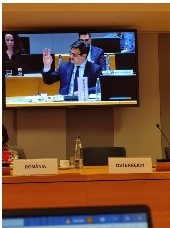
Jednání Evropské rady z odposlechové místnosti a rozhovoru maďarský velvyslanec