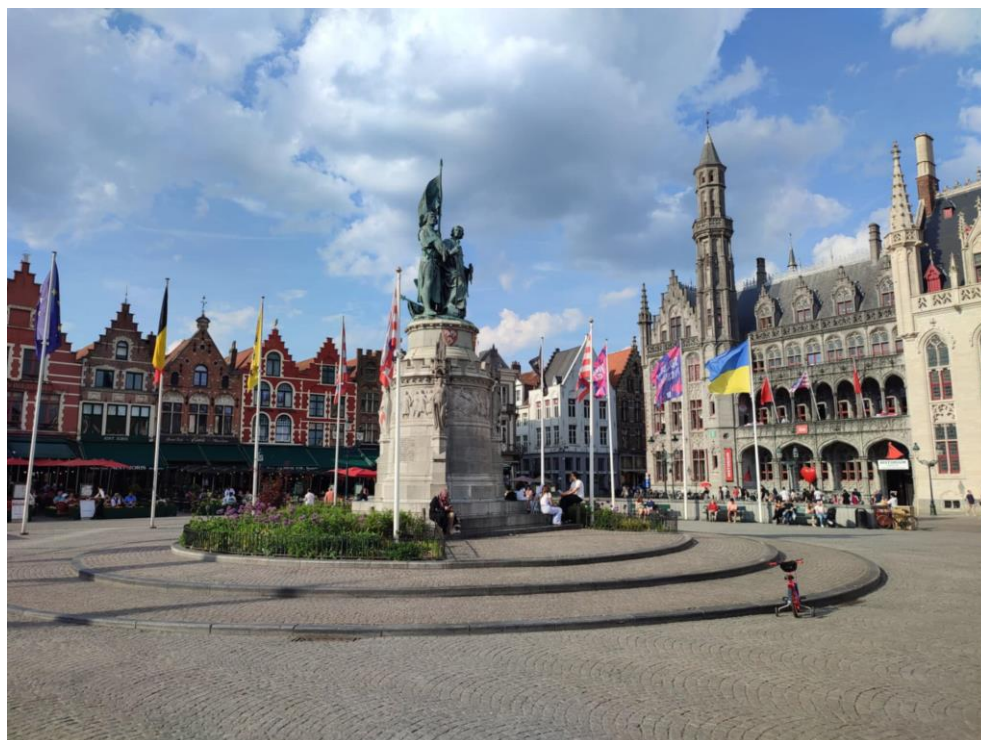
... vs. malebný zbytek Belgie